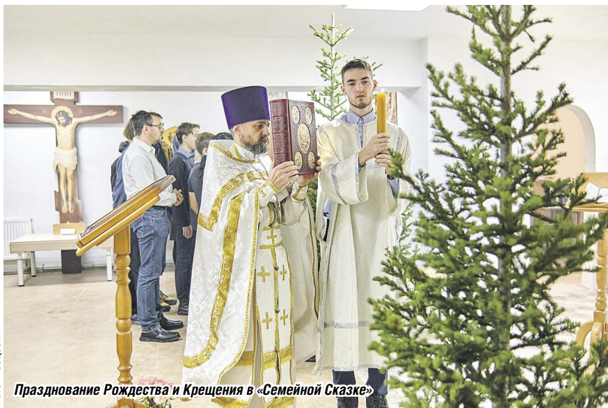
Празднование Рождества и Крещения в «Семейной Сказке»

В этом году два светлых праздника – Рождество Христово и Крещение Господне – впервые отпраздновали в обновлённом цоколе строящегося храма в посёлке Ложок в микрорайоне «Семейная сказка».