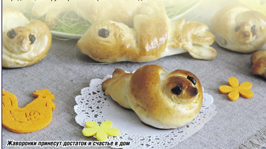
Жаворонки принесут достаток и счастье в дом

Отведать эти восхитительные булочки и насладитесь атмосферой традиций и радости, которую приносит Сретение Господне.