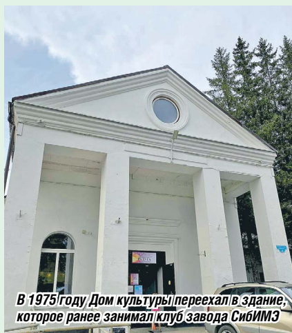
В 1975 году Дом культуры переехал в здание, которое ранее занимал клуб завода СИБИМЗ