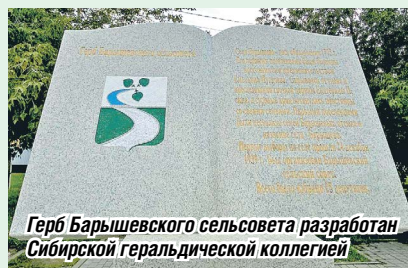
Герб Барышевского сельсовета разработан Сибирской геральдической коллегией

История села Барышево уходит корнями во времена Российской империи. Согласно данным архива Новосибирского района, оно было основано в 1775 году. Первыми поселенцами стали участники Пугачёвского восстания, скрывавшиеся от преследования царских властей. Это были несколько семей Барышевых, именно они, считается, и дали название селу. Наиболее ранние сведения о поселении содержатся в справочнике «Список населённых мест Российской империи по сведениям 1859 г. Томская губерния», в котором указано, что деревня заводского ведомства Барышева (Балышева) Томского округа находилась на левом берегу р. Ини и насчитывала 35 дворов. В 1884