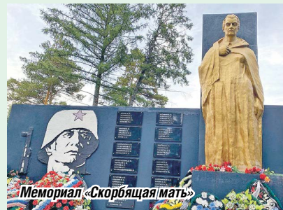
Мемориал «Скорбящая мать»

К первому упоминанию о культурной деятельности в селе можно отнести материал в газете «За сталинский урожай» 1939 года. В заметке рассказывается об избе-читальне, где собирались односельчане и обсуждали текущие моменты жизни страны и села. В свободное время там пели и устраивали репетиции агиткультурбригады. Дом культуры был образован